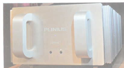
Plinius från Nya Zeeland är ett nytt märke hos Tonkraft. Här slutsteget SA-Reference.