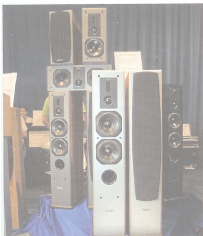
JWS visade bland annat Dynavoice De-finition DF-5 med dubbla diskant, en kalott för nedre diskant och ett bandele-ment för toppen. Det är ovanligt för en högtalare i tretusen-kronorsklassen.