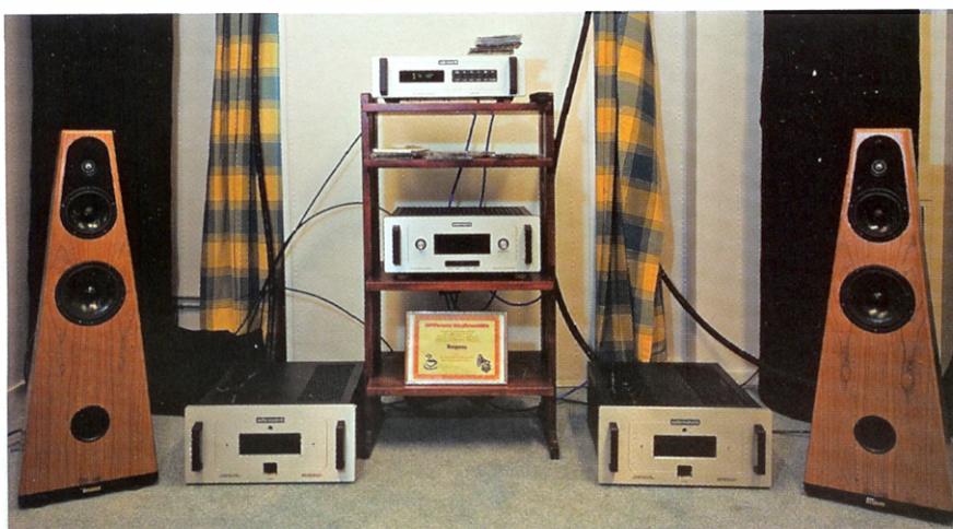
I detta lilla, men mycket välbesökta, rum fanns högtalartillverkaren Respons. På bilden ser vi Grand Artist och elektronik från Audio Research (nästan hela Reference-serien). Imponerande realism!