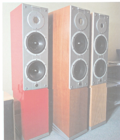
Ljudtema spelade på Naim elektronik och högtalare från Audiovector Mi 3, här Avantgarde Arreté LE, Avantgarde SE och Signature SE. Den lilla omkopp-laren är ny, med den kan man koppla in något som kallas ARA (Audiovector Ro-om Adaptaion) och ska minska effekten av resonanser i sparsamt möblerade rum utan tjocka mattor.